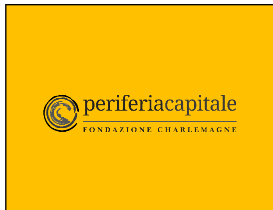
Con sfondo fotografico