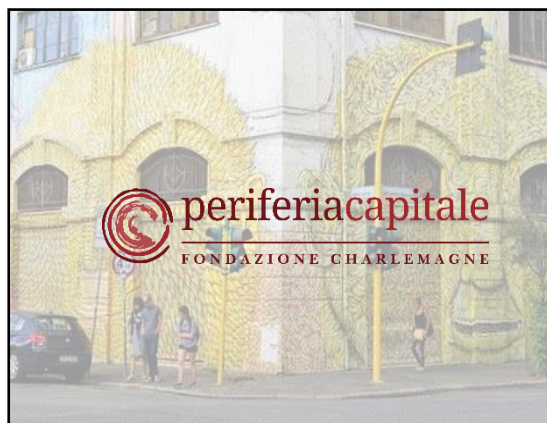
con sfondo immagine dipende dallo sfondo