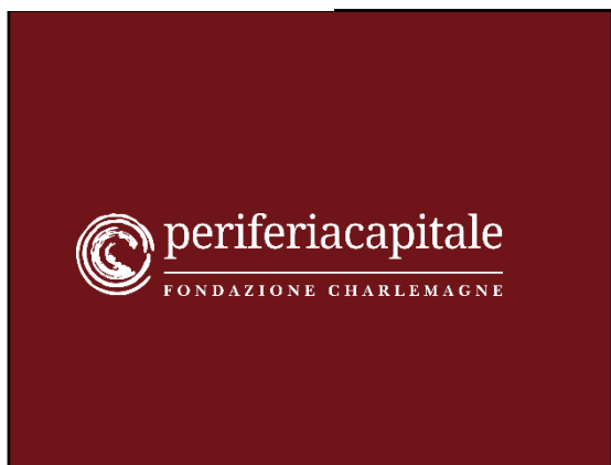
Con sfondo rosso