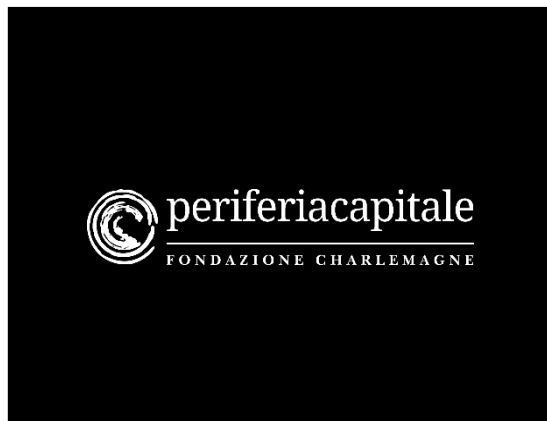
Con sfondo nero o scuro