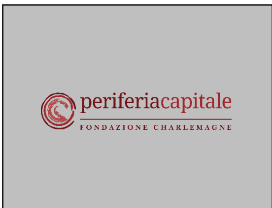
Con sfondo grigio