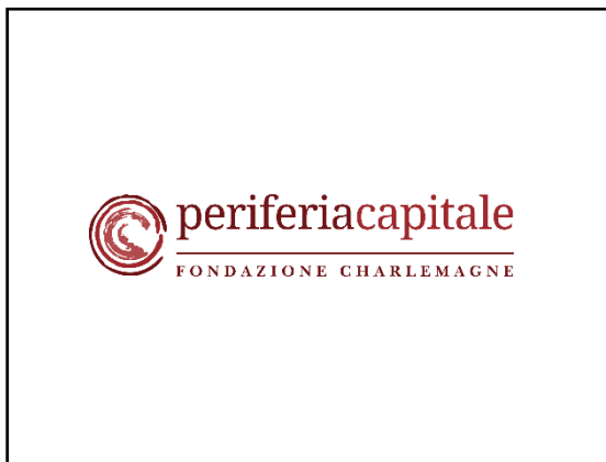
Con sfondo chiaro

Se s'intende trasporre il logo su carta stampata, per assicurare la perfetta leggibilità del marchio è previsto un limite di riduzione al quale è necessario attenersi. Pertanto non potrà essere rappresentato con una larghezza inferiore ai 20 mm. Per la sua apposizione su pagine web il logo non dovrà avere dimensioni inferiori a 300px di larghezza.